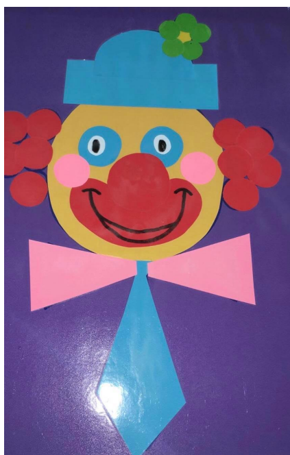
Rysunek 2. Klaun wykonany przez dzieci techniką orgiami.

Rodzina wróciła z powrotem do domu samochodem (mówimy „brum brum”). Na kolację Lomama przyrządziła cynamonowe placki, które wszyscy zjedli z apetytem (mniam, mniam). Po kąpieli Logutek ucałował rodziców na dobranoc (cmokamy). Po dniu pełnym wrażeń położył się spać i mocno zasnął (chrapiemy).